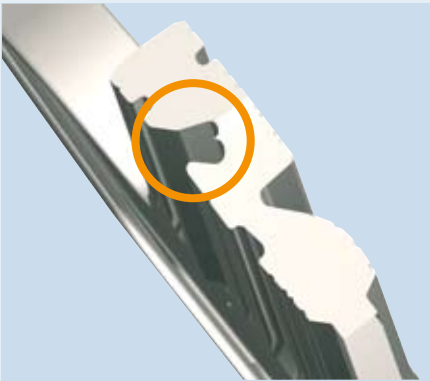
Schutz gegen Picking durch überlappendes Schlüsselprofil