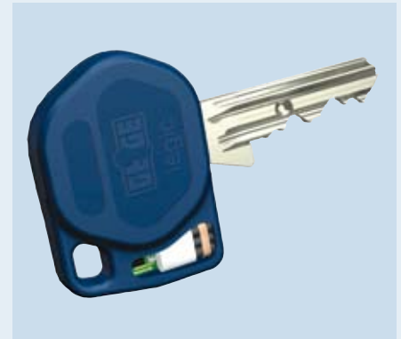
Mechatronischer Schlüssel Gege eolegic

Kaba GmbH Philipp-Reis-Straße 14 63303 Dreieich Telefon +49 6103 99 07-100 Fax +49 6103 99 07-133